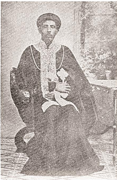
አቡነ ጌጥሮስ (መገርሳ በዳሳ)

የማንበብ ክሂላችሁን እንድትጠቀሙ የሚረዱ ምንባብ እና የመልመጃ ጥያቄዎች ቀርቦዋል። ምንባቡን በትኩረት አንብባችሁ ጥያቄዎቹን በተገቢው መንገድ ስሩ።