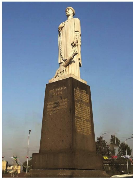
የአቡነ ጌጥሮስ ሀውልት