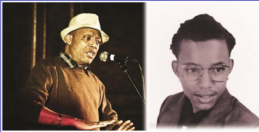
አርቲስት ዓሊ ቢራ