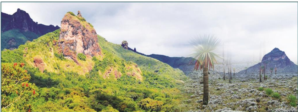
የባሌ ተራራዎች ብሄራዊ ፓርክ